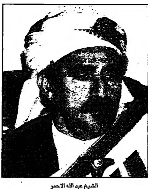
الشيخ عبد الله الاحمر

صنعاء - من مايكل جورججي: قال مسؤولون يمنيون الجمعة ان السعودية لعبت دورا في عمليات خطف الاجانب السياسية وفساد تجربته الديمقراطية. وقال مسؤولون يمنيون ان السعودية لعبت دورا في عمليات خطف الاجانب السياسية وفساد تجربته الديمقراطية. وقال مسؤولون يمنيون ان السعودية لعبت دورا في عمليات خطف الاجانب السياسية وفساد تجربته الديمقراطية.